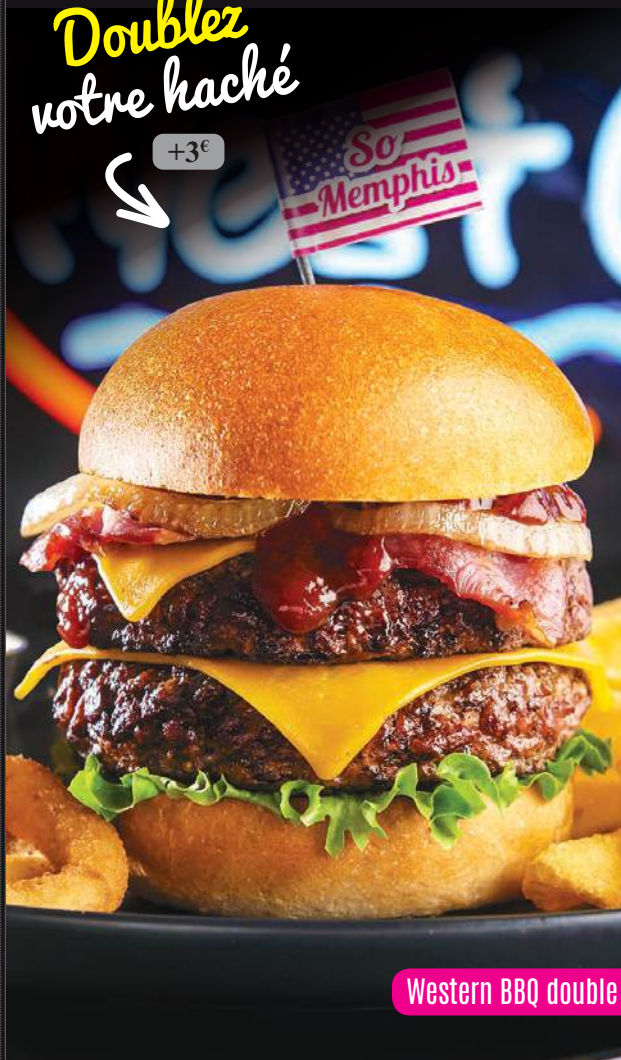
Western BBQ double