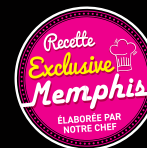
Trio de Caesar Tacos