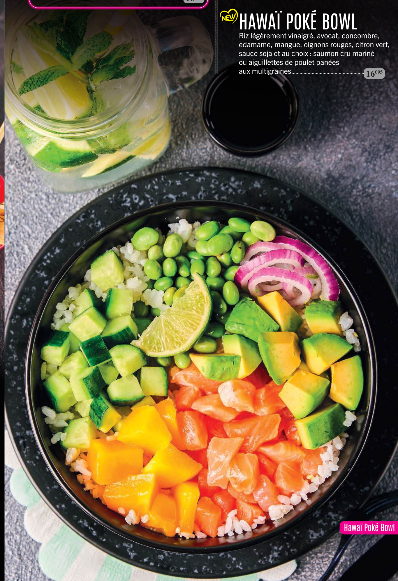
Hawaï Poké Bowl