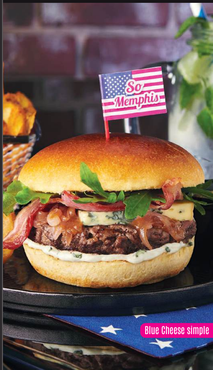
Blue Cheese simple

TOUS NOS BURGERS SONT ACCOMPAGNÉS DE TRADITIONAL ONION RINGS ET SERVIS AVEC FRITES ET SAUCE MEMPHIS (1) .