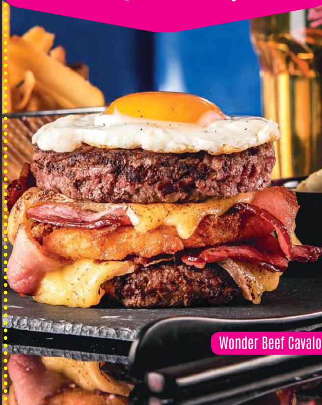
Wonder Beef Cavallo